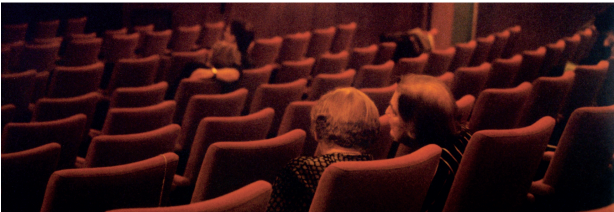
SIDEORDNET. På ét eneste virkeligt sted sideordner teatret flere rum, flere placeringer, som i sig selv er uforenelige. På denne måde kan teateret fremvise en hel serie af steder, hver især fremmede for hinanden, på scenens firkant.

Billedteksterne er inspireret af Michel Foucaults 'Andre Rum', trykt i tidsskriftet Slagmark nr. 27, vinter 1997/98. Foucault nedskrev 'Andre Rum' under et ophold i Tunesien og holdt det som foredrag i Paris den 14. marts 1967.