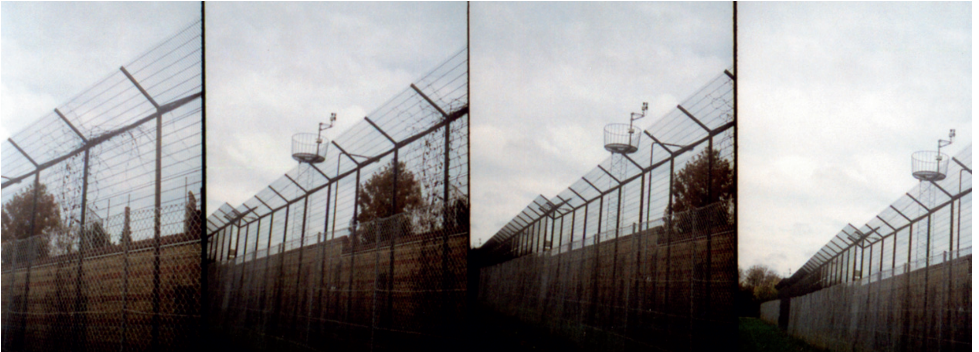
AFVIGENDE. I fængslet anbringes de individer, hvis adfærd er afvigende i forhold til gennemsnittet eller den krævede norm.