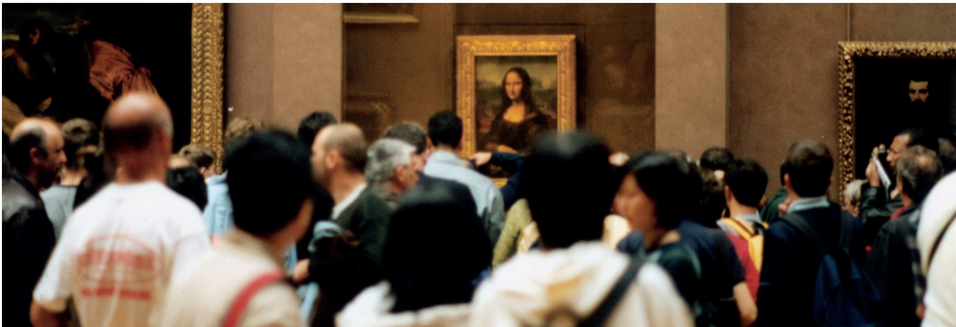
AKKUMULERENDE. På museer og biblioteker hober tiden sig op og bliver ved med at placere sig oven på sig selv.