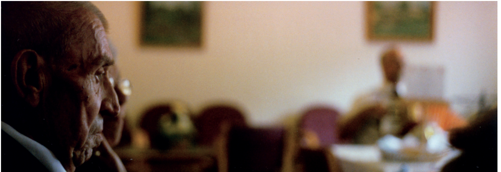
KRISE. Alderdommen er i grunden en krise, men også en afvigelse, fordi lediggang udgør en slags afvigelse i et samfund som vores, hvor fritid er normen.