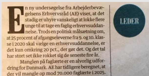
Berlingske, 24/7 2020

NCUM | Nationalt Center for Udvikling af Matematikundervisning | ncum.dk