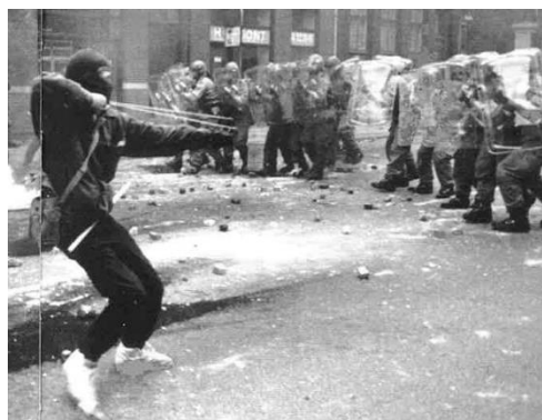
BZ'ere i gadekamp 1986