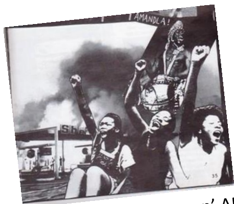
Støtte til 'terrorgruppen' ANC. BZ-bladet Fingeren 1987