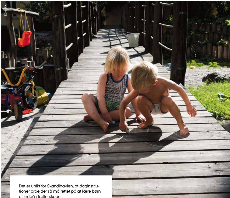
Det er unikt for Skandinavien, at daginstitutioner arbejder så målrettet på at lære børn at indgå i fællesskaber.