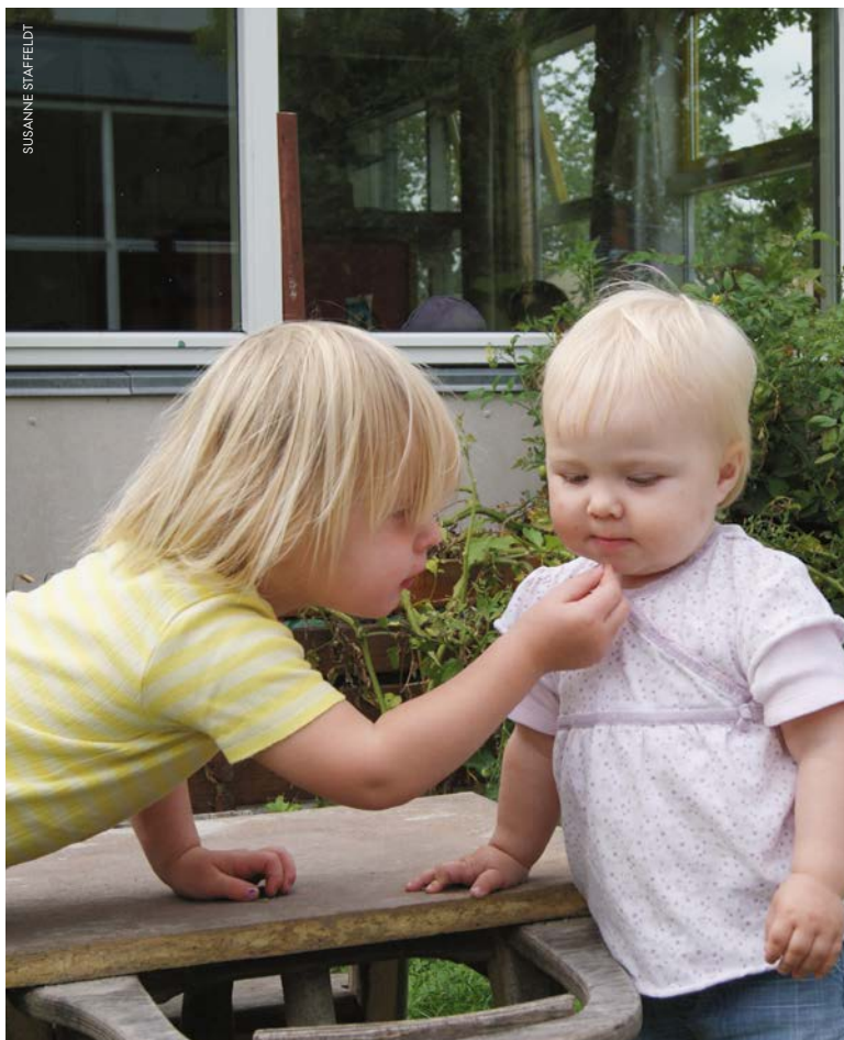
Daginstitutionen er nutidens svar på barndommens gade. Det er her, børn skal lære at være sammen med andre børn.

lovgive om, at alle børn skal i vuggestue, når de fylder et år.”