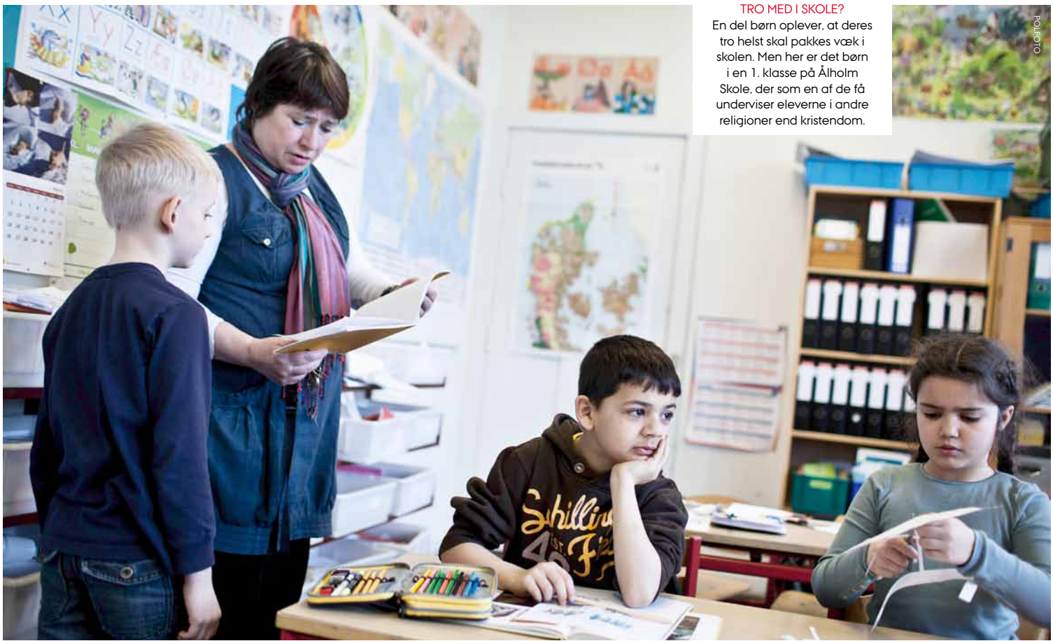
TRO MED I SKOLE? En del børn oplever, at deres tro helst skal pakkes væk i skolen. Men her er det børn i en 1. klasse på Ålholm Skole, der som en af de få underviser eleverne i andre religioner end kristendom.