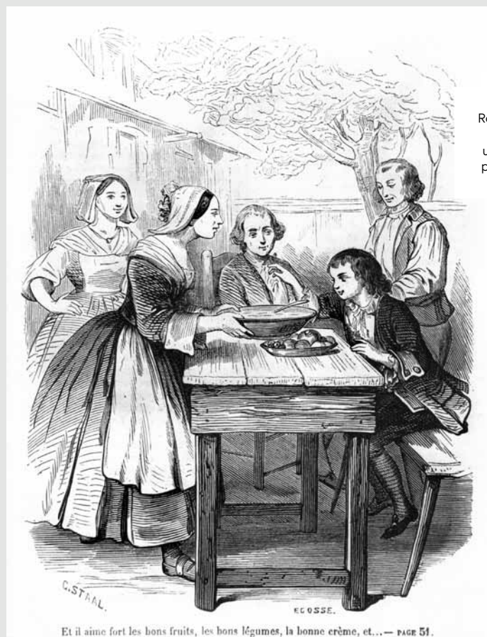
Et il aime fort les bons fruits, les bons légumes, la bonne crème, et... — PAGE 51.